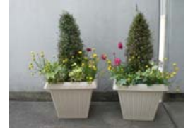
ウエルカムフラワー