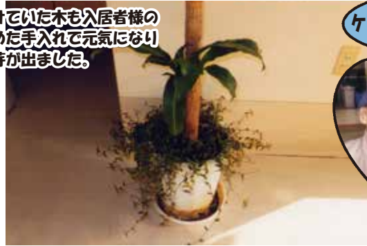
ケアハウスの紳士たち