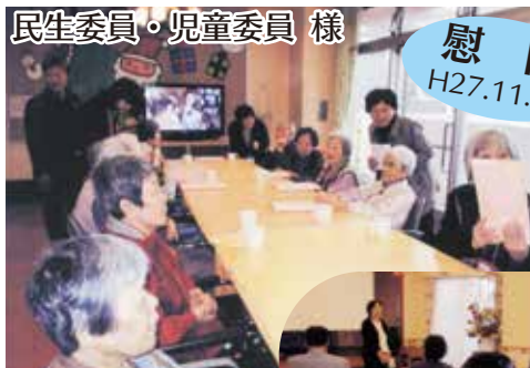
民生委員・児童委員様