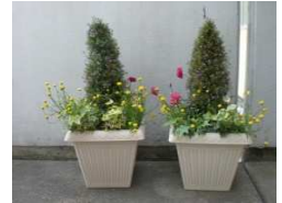
ウエルカムフラワー