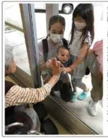
窓越しにご家族と面会される様子

今年はお会いしますように! 令和2年に引き続き、昨年も新型コロナウイルスの猛威に振り回された一年となってしまいました。当施設でも、面会の制限を続けざるを得ない日々が続きます。本心に苦しいばかりです。職員一同、一日も早い混乱の収束を願うばかりですが、そんな中でも工夫を凝らし、ご家族との時間を過ごしていただけるように努力しております。リモートや窓越しでの面会にはなってしまいますが、それでもご家族の顔を見れる喜びは大変大きなものです。また、入居者様職員一同のワクチン接種も滞りなく進めてまいりました。全国の接種率も上がってきている中で、少しずつ日常生活が戻ってきていると感じる場面も増えてきたのではないのでしょうか。今年こそ、施設内にご家族との賑やかな談笑の声が聞こえることを願わずにはられません。