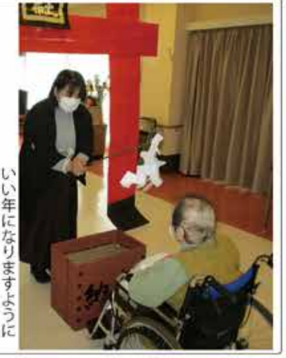
いい年になりますように