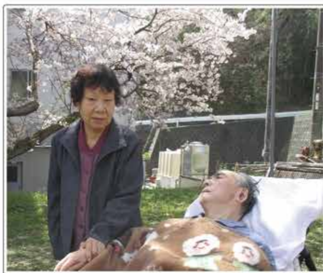
穏やかな時間を楽しめました